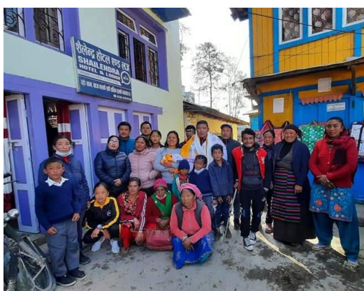
Phaplu und Sallary