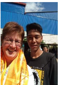
Oktober 2022, mein Besuch in Nepal

Diese Kinder haben nach gegenseitiger Absprache das NCOS Schulprogramm verlassen und wir haben ihre Unterstützung gestoppt. Besonders diesen Kindern wünschen wir nur das Beste für die Zukunft.