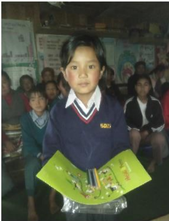
Bild: Besuch der Kinder im Solukhumbu, Nepal, Oktober 2022