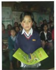
Bild Besuch der Kinder im Solukhumbu, Nepal, Oktober 2022